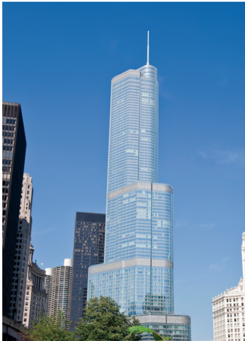
El aislamiento de lana mineral FireSpan® de Thermafiber® provee los componentes críticos y necesarios del sistema de contención de incendios perimetral del Hotel Internacional Trump, así como la torre en Chicago, IL.

Para obtener información adicional, consulte la hoja de Instrucciones de Uso Seguro (SUIS, por sus siglas en inglés) que se encuentra en la base de datos SDS en http://sds.owenscorning.com .